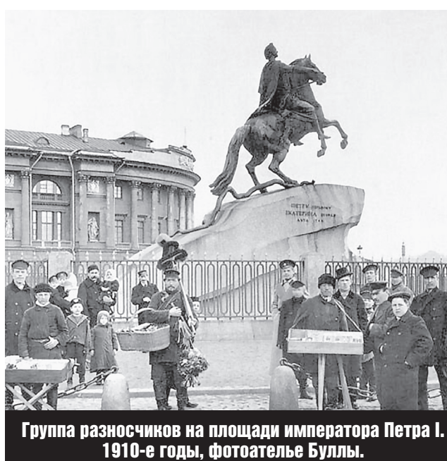
Группа разносчиков на площади императора Петра I. 1910-е годы, фотограф Буллы.