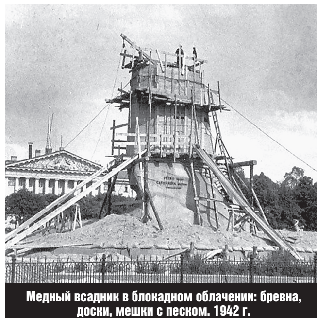
Медный всадник в блокадном облачении: бревна, доски, мешки с песком. 1942 г.