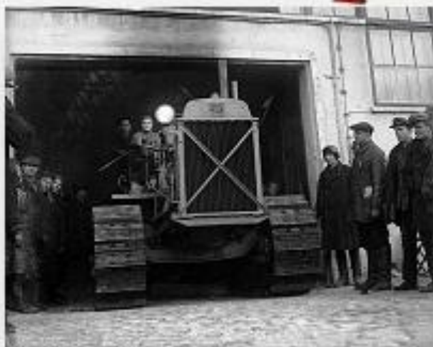
Челябинский тракторный завод