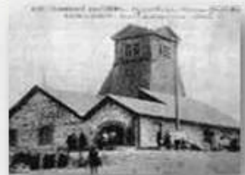
Шахты Донбаса и Кузбаса