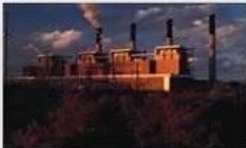
Магнитогорский, Кузнецкий металлургические комбинаты