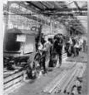
Сталинградский, Харьковский тракторные заводы