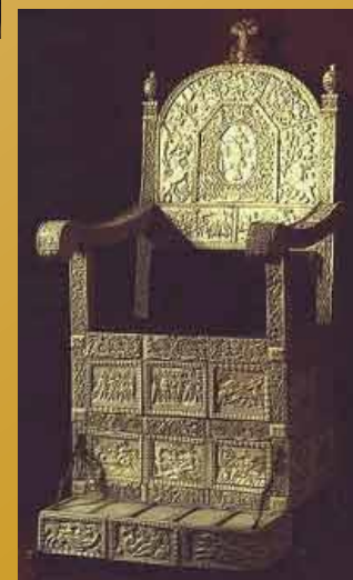
Трон Ивана Грозного