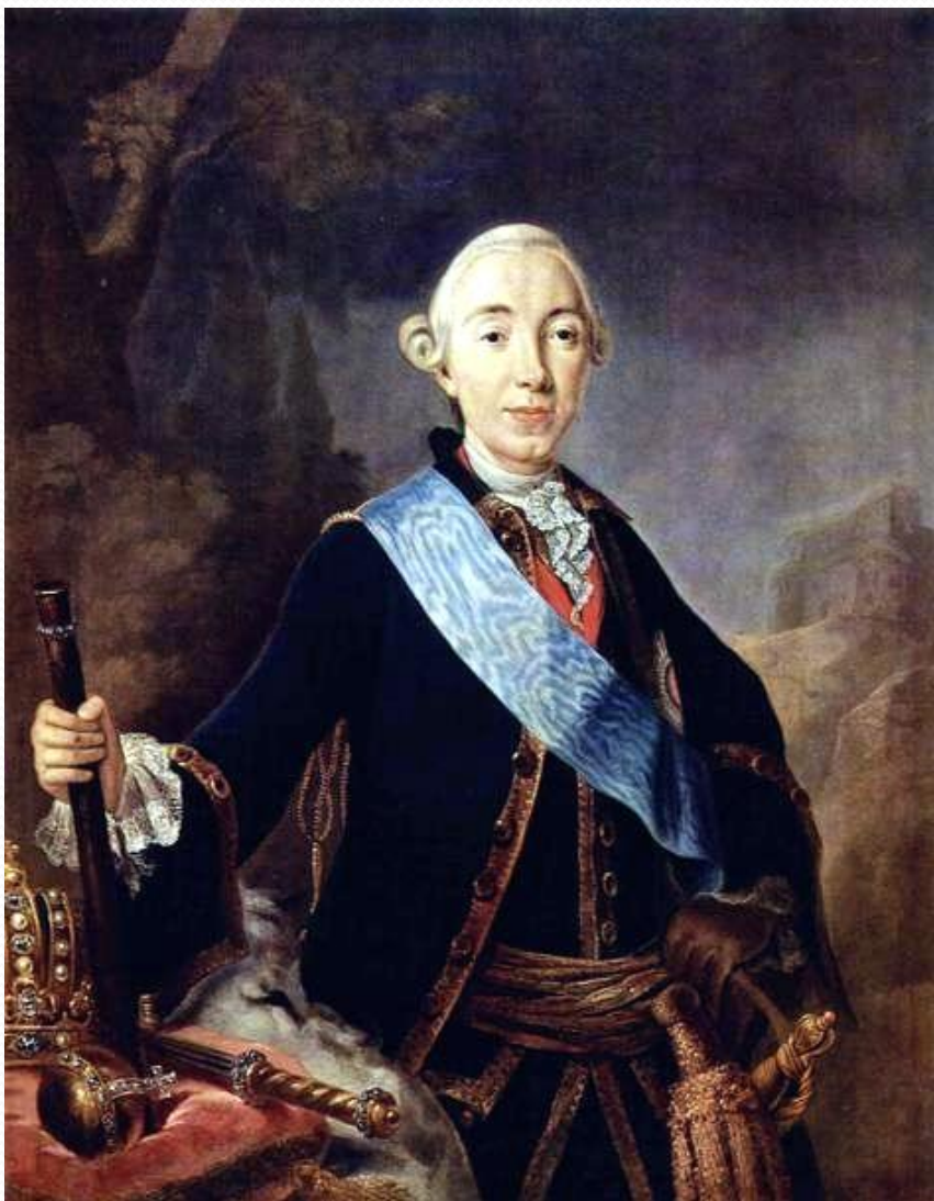
Петр III (внук Петра от дочери Анны)