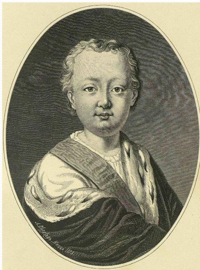
Иван VI Антонович (внучатый племянник Анны Иоанновны) 1740 - 1741