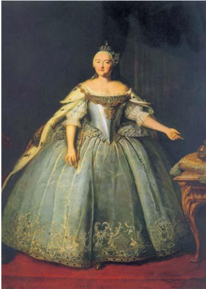
Елизавета Петровна (дочь Петра I)